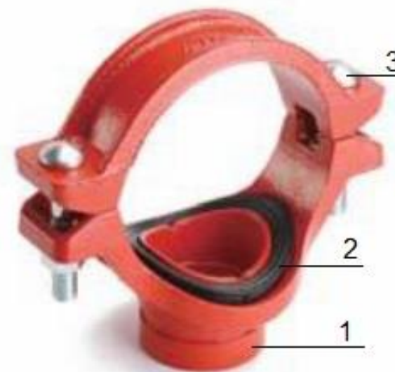
Рис.2. Отвод (седелка) под муфту «LEDE».