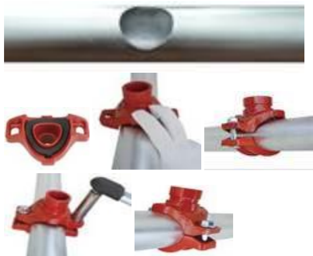
Рис.3. Установка отвода (седелка) под муфту на трубопровод.

6) Убедитесь, что зазор между верхней и нижней частями ровный и минимальный